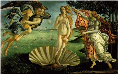
Sandro BOTTICELLI Nascita di Venere , circa 1482-85