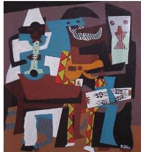
Pablo PICASSO I tre musicisti , 1921